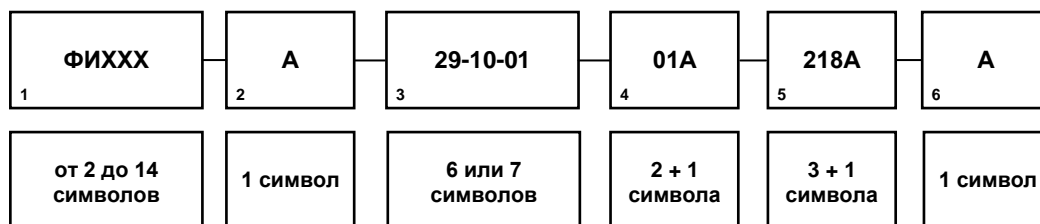
Рисунок А.1 – Структура ОМД

А.3.1 ОМД состоит из структурированного набора элементов, каждый из которых представляется одним или несколькими алфавитно-цифровыми символами (рис. 1).