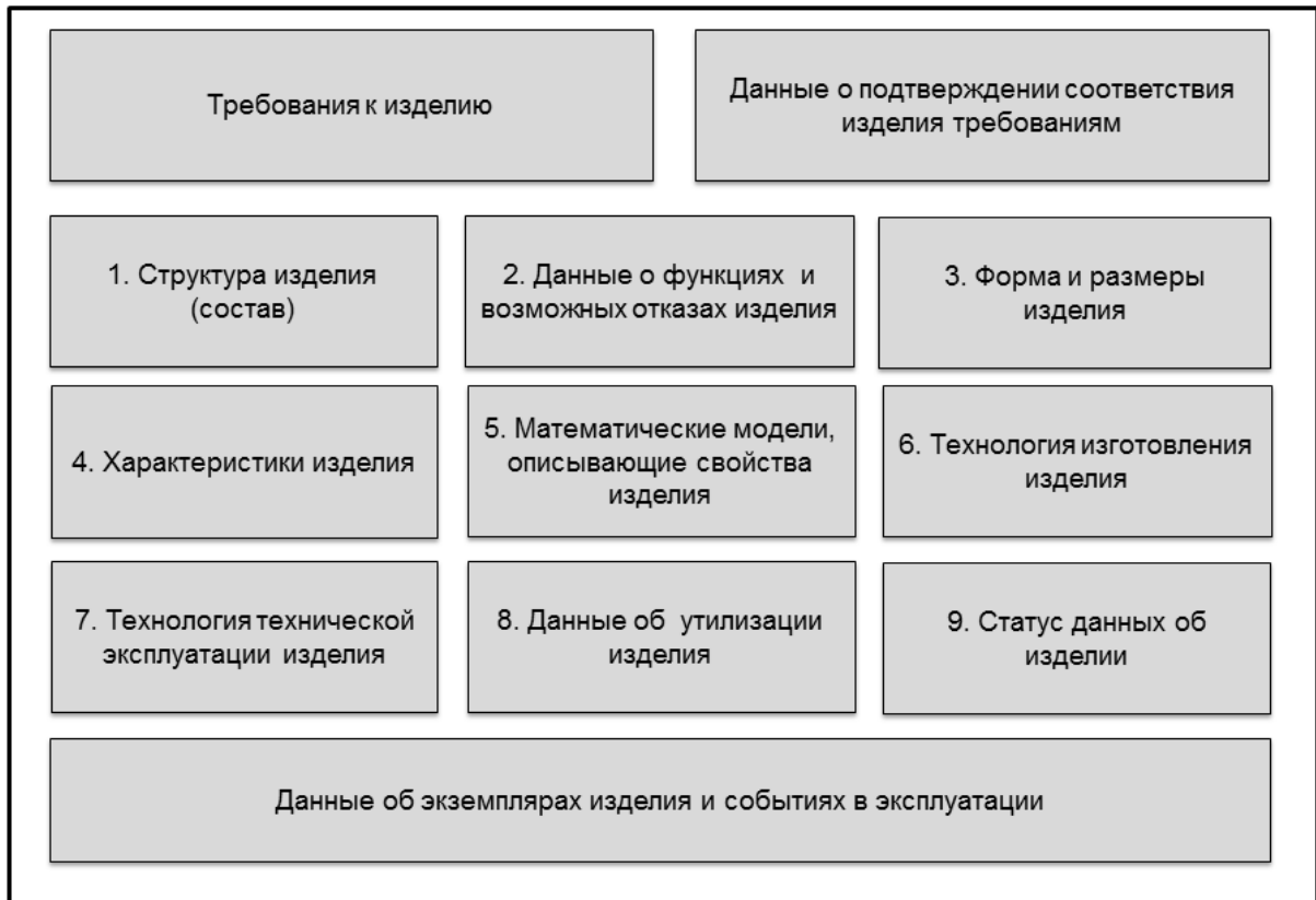
Рисунок 2 — Данные об изделии в АС УДИ

4.7 Нормативно-справочная информация в АС УДИ в общем случае может включать (но не ограничена указанными ниже):