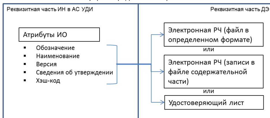
Рисунок 1 — Схема преобразования ИН в ДЭ

Изменение формы представления реквизитной части